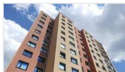
Technologie Novabrik patří do státního dotačního programu Nová zelená úsporám, ušetřit můžete až 30 % nákladů.

V současnosti probíhá tzv. druhá výzva pro bytové domy , do níž se lze přihlásit kdykoliv do konce roku 2021 , kdy tato výzva končí. O podporu dotace mohou zažádat jak fyzické osoby, tak i společenství vlastníků jednotek, bytová družstva nebo města a obce. Žádost se podává výhradně elektronicky prostřednictvím online formuláře na webových stránkách programu Nová zelená úsporám.