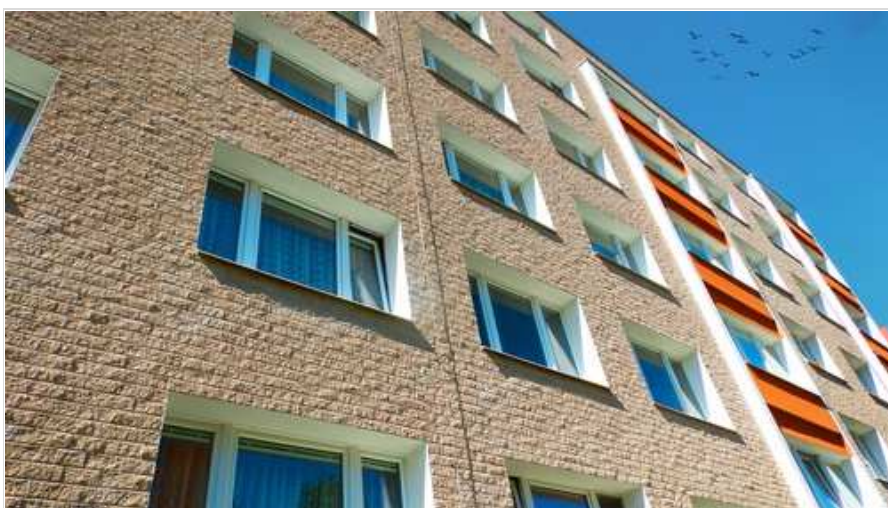
Fasádní systém Novabrik je ideální právě pro výškové stavby či bytové a panelové domy

další informace o firmě vyžádat další informace