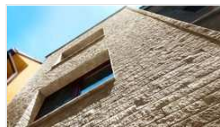
Fasády svým vzhledem připomínají přírodní kámen

Zateplení bytových domů betonovými obklady Novabrik, které svým vzhledem připomínají přírodní kámen a jsou k dostání v jedenácti barevných provedeních, je výhodné také díky faktu, že zmíněná technologie patří do státního dotačního programu Nová zelená úsporám . Díky němu můžete ušetřit až 30% vašich řádně doložených výdajů!